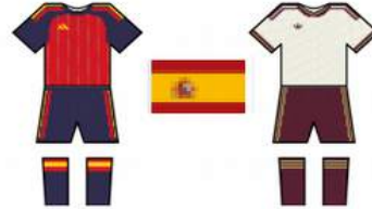
Trikot Espana

En 2026 ya jugaron partidos amistosos, entre otros, contra la selección de fútbol de Egipto y la selección de Serbia. En junio, jugarán, entre otros, un partido amistoso contra Perú en el Estadio Estadio Cuauhtémoc, Puebla (México)).