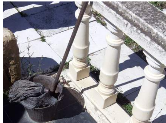
Imagen simbólica Monumento a la mopa en Trasmoz

La imagen muestra un monumento (fregona de bronce)