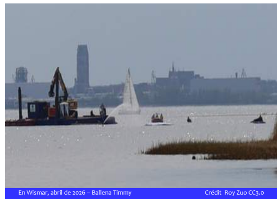
En Wismar, abril de 2026 – Ballena Timmy