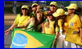
Imagen crédito Florian A CC3.0