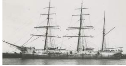
Barco de cuatro mástiles Lorton (construido en 1888)..

i-Cosmos Lima – Por ejemplo, Perú se solidarizó con los Estados Unidos (¿probablemente también en 1917?), después de que submarinos alemanes hundieran también barcos bajo bandera peruana, Perú rompió posteriormente las relaciones diplomáticas con el entonces Imperio Alemán. ¿Era el barco 1 el Lorton (imagen) a 11 millas náuticas al este de Santander ( norte de España )?