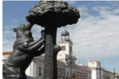
Puerta del Sol, El Oso y el Madroño