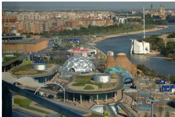
Imagen simbólica EXPO 2008 (Expo Zaragoza 2008)

Portal Oficial de Turismo de España: Acuario-Zaragoza