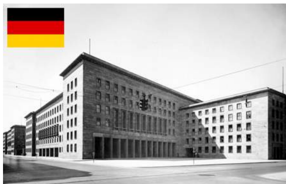
Imagen del Ministerio de Aviación de Alemania en la Segunda Guerra Mundial (Wilhelmstrasse 97). Crédito: Hagemann, Otto (CC 3.0), Berlín, 1938

Más tarde, representantes de los EE. UU., Inglaterra (el Reino Unido) y la Unión Soviética se alojaron en este edificio; los EE. UU., de hecho, ¡hasta tan tarde como 1952! En 1949, la República de la «RDA Alemania » —cuyo nombre original previsto era «República Democrática»— fue fundada en este mismo edificio por un consejo multipartidista. Temas de Berlín... por descubrir.