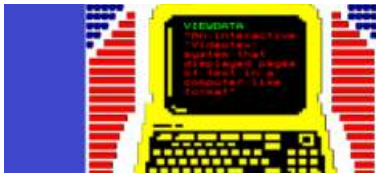
View Data

Haga clic en la imagen (computadora) para ir a i-Teletipo .