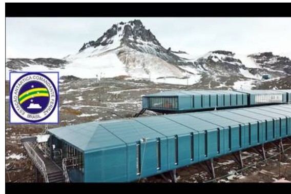
Estación Antártica de Brasil 2020

Mundos Árticos – InfoK/ i-Cosmos – Nuestro boletín electrónico del Club Americano InfoK también ofrece secciones sobre Brasil. Este país es gigantesco en comparación con la mayoría de los países europeos. A partir de marzo de 2026 ofreceremos una página de servicios de la Antártida en Club-InfoK-EU , que también incluye estaciones en la Antártida , entre ellas la estación brasileña. Tal vez un tema completamente nuevo de descubrimiento para los lectores y los viajeros de estudios. Argentina y Chile fueron de los primeros en la Antártida, ya que en parte la consideran una continuación de su territorio geológico. Más en nuestra nueva página de servicios – sección de divulgación científica. También hay turismo en la Antártida.