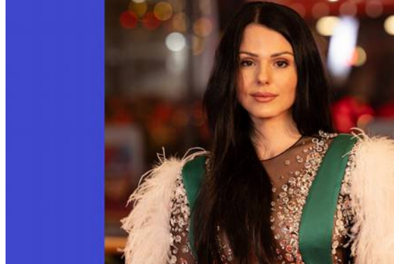
Sra. Schweighöfer alias Ruby O. Fee Berlinale 2025

Con su esposo Schweighöfer , ya participó en la coproducción "Army of Thieves" ( EE. UU. , Alemania) como Korina, que se puede ver en el servicio de streaming de Netflix, una comedia de acción y humor negro .