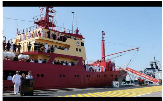
Buque de investigación para los océanos del sur y la Antártida