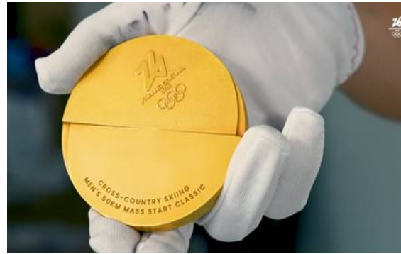
Imagen medalla Milán-Cortina 2026