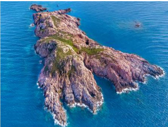
Rossa, del nombre del lugar en Cerdeña