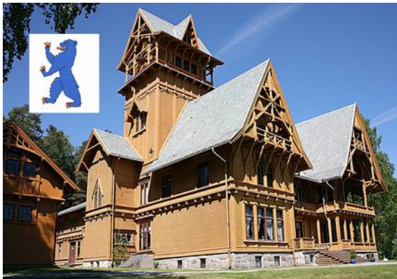
Imagen simbólica. Arquitectura en la provincia de Buskerud, Noruega, cerca de Oslo – quizás no típica Villa Fridheim