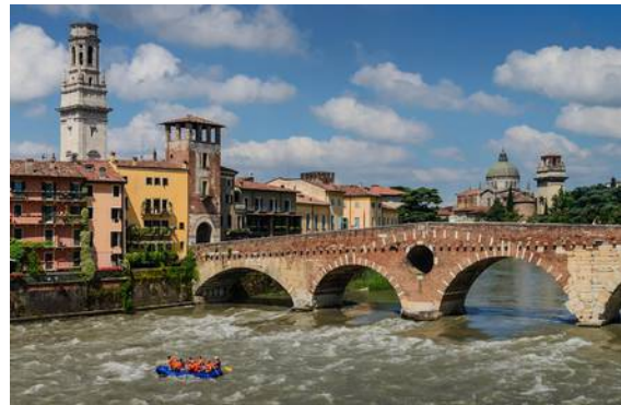
Imagen simbólica de Verona Ciudad junto al río

En el año 2000, Verona fue reconocida por la ONU como Ciudad del Patrimonio Mundial.