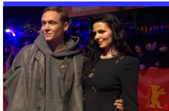
Berlinale Apertura 2026 La pareja Schweighofer

Matthias Schweighöfer es considerado un actor versátil, que también interpreta villanos o personas buenas, y pronto reconoció su pasión por la dirección.