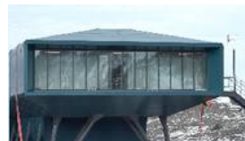
Brasil: Estación Antártica Mar

Mundo – InfoK – Aún en 2026 comenzará el proyecto i-Cosmos, con las primeras páginas de servicio para Sudamérica. Situado en la costa oeste de Sudamérica, el proyecto cooperará con Club-InfoK Europa y quizás mostrará otras perspectivas sobre diferentes temas. El proyecto i-Cosmos se encuentra claramente en tierra de Gondwana. La diversidad de especies, el Amazonas que comienza en Perú, los observatorios de Chile y mucho más serán temas a tratar. El mundo de Gondwana también es tema de la investigación en la Antártida (imagen). El que quizás fue el primer ser humano (de pie Lucy, para "Tú maravillosa") fue encontrado junto a la placa árabe en Etiopía, que también formaba parte de este supercontinente.