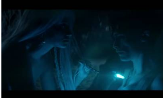
Imagen simbólica Recorte Cortometraje Marzo 2025

Sin embargo, en los propios juegos se vieron pocos turistas italianos. La mayoría probablemente venían de América, y eso podría convertirse en un problema en el futuro para Italia. Después de los Juegos Olímpicos 2026 en marzo, en nuestras páginas de servicio habrá todos los lugares y todos los deportes permanentes, si no de inmediato, ¡entonces más tarde! Todos los deportistas empezaron siendo pequeños, por ejemplo en el esquí, y algunos se quedaron en ese deporte.