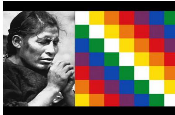
Imagen simbólica de los aymara en Bolivia y bandera de los aymara

Hoy en día se consideran países como Bolivia, Perú, Argentina y Chile como su principal hábitat.